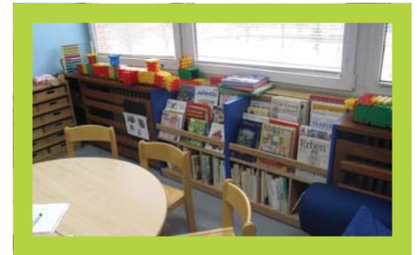
9. Kniha a písmena